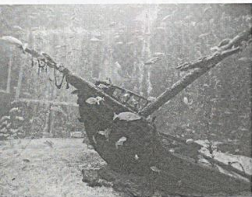
展示に一工夫を施した箱根園水族館

まだ日は高いが、さっそく大浴場へ。一番風呂かと思ったら、すでに先客数人が汗を流していた。 内風呂の二つの湯舟のうち一つはジャグジー付き。露天は岩風呂が一つで建仁寺垣に囲まれているが、その上に山が見える。 魚介が中心の和食膳 お子様ランチも用意 食事は、朝夕とも明るく開放感があるレストランでの和食膳だ。小田原漁港の魚介が中心。宿泊料金8900円では刺し身、焼き物、揚げ物など9品前後が出る。 レストランの前にはいけすが設けられ、仕入れた魚介が泳いでいる。