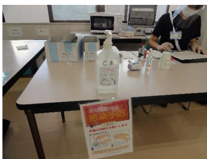
入口等に消毒液を設置しております。また、検査機器類の消毒も行っております。