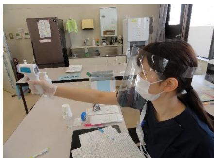
健診前に体温測定を実施させていただきます。